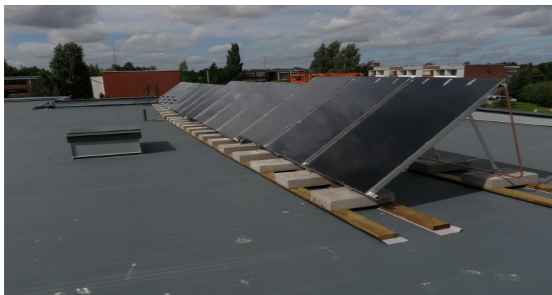
Mynämäen HaniHallin katolla sijaitseva aurinkokeräin

Elinkeinopoliittisen ohjelma hyväksytty kunnanvaltuustossa 3.3.2014.