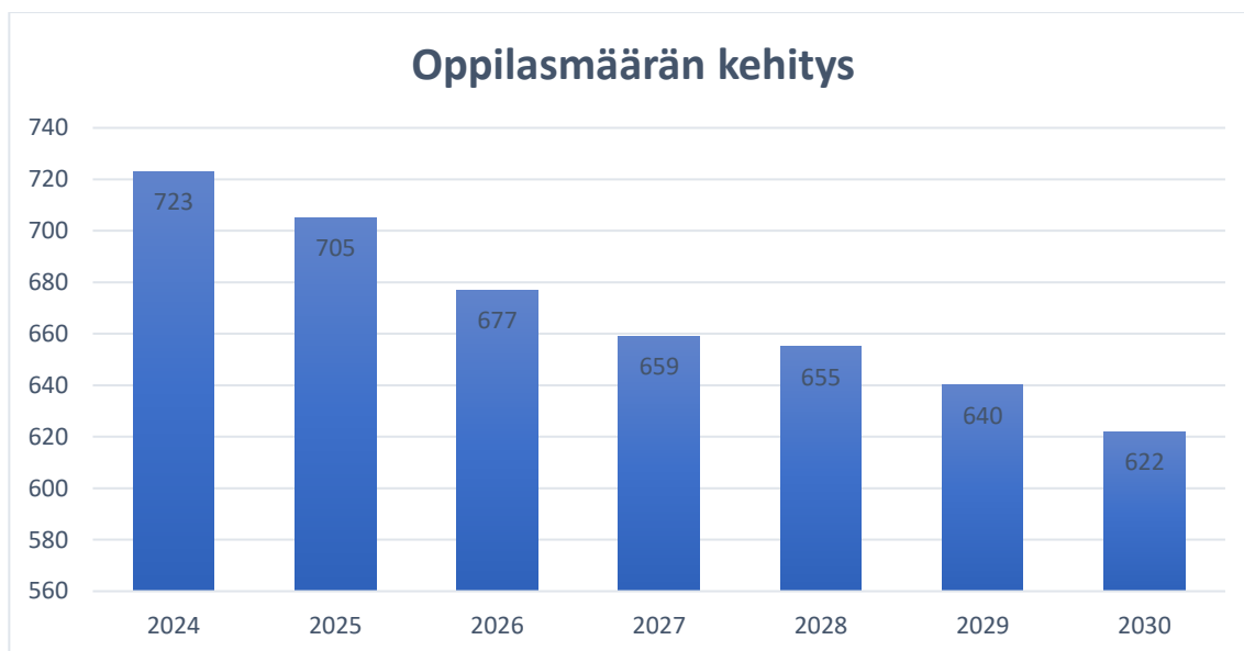
Kuvio A: Mynämäen perusopetuksen oppilasmääräennuste 2024-2030.